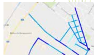
Stärke des Unterbaus farbkodiert